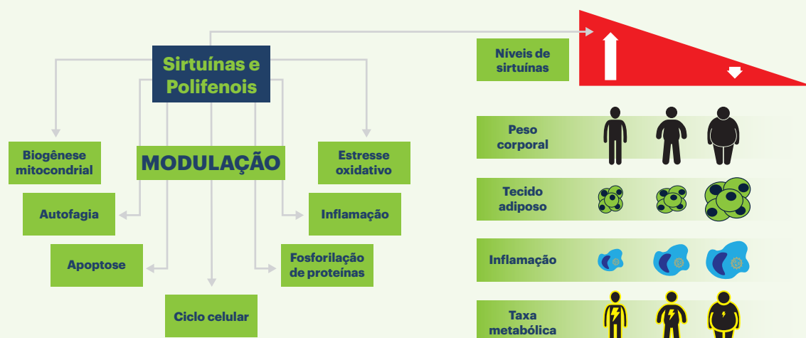
Figura 1. Benefícios das sirtuínas no organismo humano (MARIANI et al., 2018; AJAMI et al., 2017).

Estudos indicam que a ativação da SIRT1, por restrição calórica e por ativos naturais, como SIRTCONTROL® , correspondem a uma estratégia promissora na prevenção e tratamento de diversas doenças crônicas e síndrome metabólica.