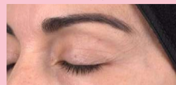
Avaliação da ação anti-rugas de Dunalina® em duas voluntárias