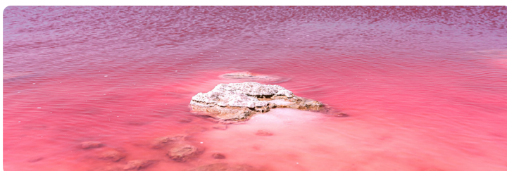
Imagens da atividade da Dunaliella salina na natureza