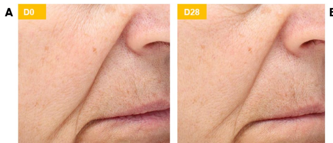
Figura 3. Linefill™ diminui o volume da prega nasolabial em 9,2% em comparação com o início do estudo (D0).