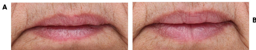
Figura 2. Aumento de 23% no volume dos lábios em 28 dias.