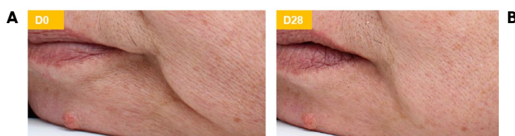
Figura 4. O número de rugas laterais no grupo tratado com Linefill™ diminuiu 58,8% em comparação com D0, além de reduzir a profundidade em 18,5%. Efeito preenchedor visível em apenas 28 dias!