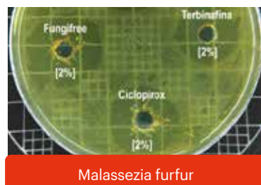
Figura ilustrativa com placas de Petri cultivadas com leveduras exibindo halos de inibição (mm) diante da concentração de 2% dos compostos avaliados.